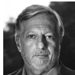
>> Juan José Aranguren

Ing. Químico y Lic. en Ingeniería de Sistemas (UBA). Fue Presidente de Shell Argentina y de la Cámara de la Industria del Petróleo. Ex Ministro de Energía y Minería de la Nación. Actualmente dirige la consultora ENERGY Consilium y es Coordinador académico de la Certificación Avanzada en Gestión de Transiciones Energéticas del ITBA.