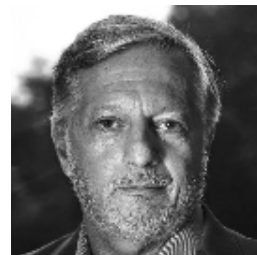
>> Juan José Aranguren

Ing. Químico y Lic. en Ingeniería de Sistemas (UBA). Fue Presidente de Shell Argentina y de la Cámara de la Industria del Petróleo. Ex Ministro de Energía y Minería de la Nación. Actualmente dirige la consultora ENERGY Consilium y es Coordinador académico de la Certificación Avanzada en Gestión de Transiciones Energéticas del ITBA.